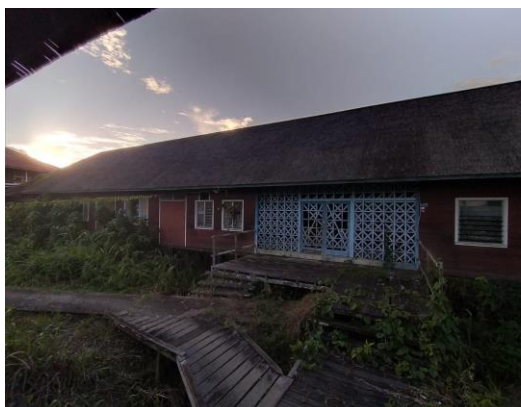
Gambar. 2 Rumah Sakit ST. Yoseph