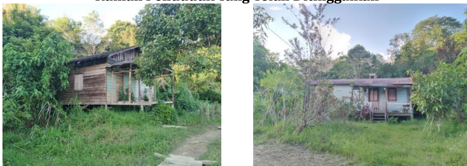
Gambar. 1 Rumah Penduduk Yang Telah Ditinggalkan